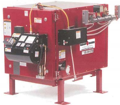
CB-200-CTB 簡易式ボイラー 伝熱面積：3.6 m 2