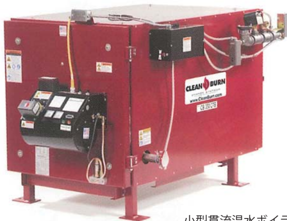
CB-350-CTB 小型貫流温水ボイラー 伝熱面積：6.3 m 2

燃料費・廃油処理費をダブルで節約！ 生活温水、洗車、床暖房、融雪にご利用いただけます！