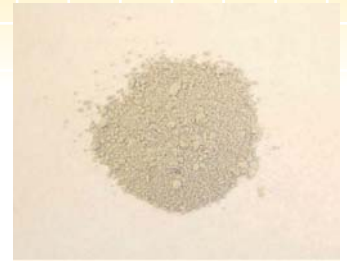
CBボイラーによる完全燃焼の灰